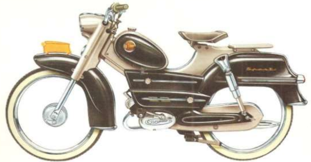
TYPE GF 50 TOUR