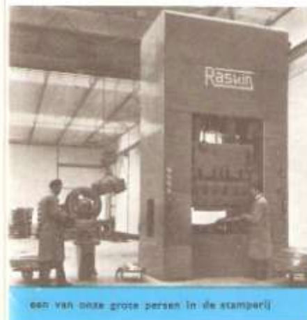
een van onze grote persen in de stamprij