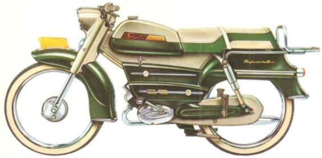
TYPE GF 50 SPORT