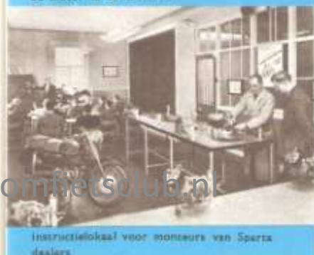
instructie-lokaal voor monteurs van Sparta-dealers

die enig idee geven van de verwerking van ruw materiaal tot complete bromfiets. In dit opzicht neemt onze fabriek een unieke plaats in en behoort tot de zeer weinige bromfietsfabrieken waar vrijwel alle voor de fabricage benodigde delen geheel volgens eigen ontwerp en in eigen beheer worden vervaardigd. Dit alles is een uitvloeisel van onze 30-jarige ervaring op motorrijwielgebied, een ervaring waarop geen andere Nederlandse en slechts weinig buitenlandse fabrieken kunnen bogen. Voegt men daarbij de nog oudere ervaring van de ILO-fabrieken dan is het volkomen verklaarbaar dat ook voor bromfietsen de naam „Sparta“ een begrip is geworden. De uitvoering van de GF 50 Tour en Sport modellen is vergeleken met hun voorgangers geheel veranderd. Vooral in esthetisch opzicht. Spatborden, motorschilden, tank en dubbelzit zijn tot een zeer modern en fraai geheel geworden. Met zijn sierlijsten en grote fraaie achterlicht doet de constructie veel denken aan de moderne strakke lijn van de huidige automobielen. Voor de liefhebbers van een sportieve bromfiets is een nieuw type Sparta GF 50 Sport Speciaal aan ons leveringsprogramma toegevoegd. De Sparta MC 50 die door zijn speciale bouw een bijzondere plaats inneemt onder de Nederlandse bromfietsen, werd in uitvoering niet gewijzigd.