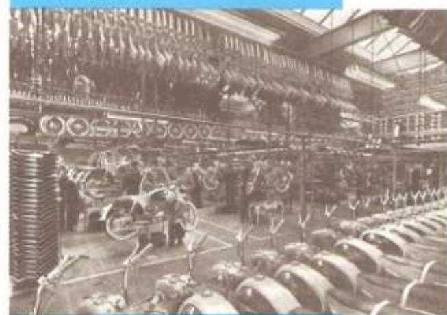
bromfietsmontage aan de lopende band